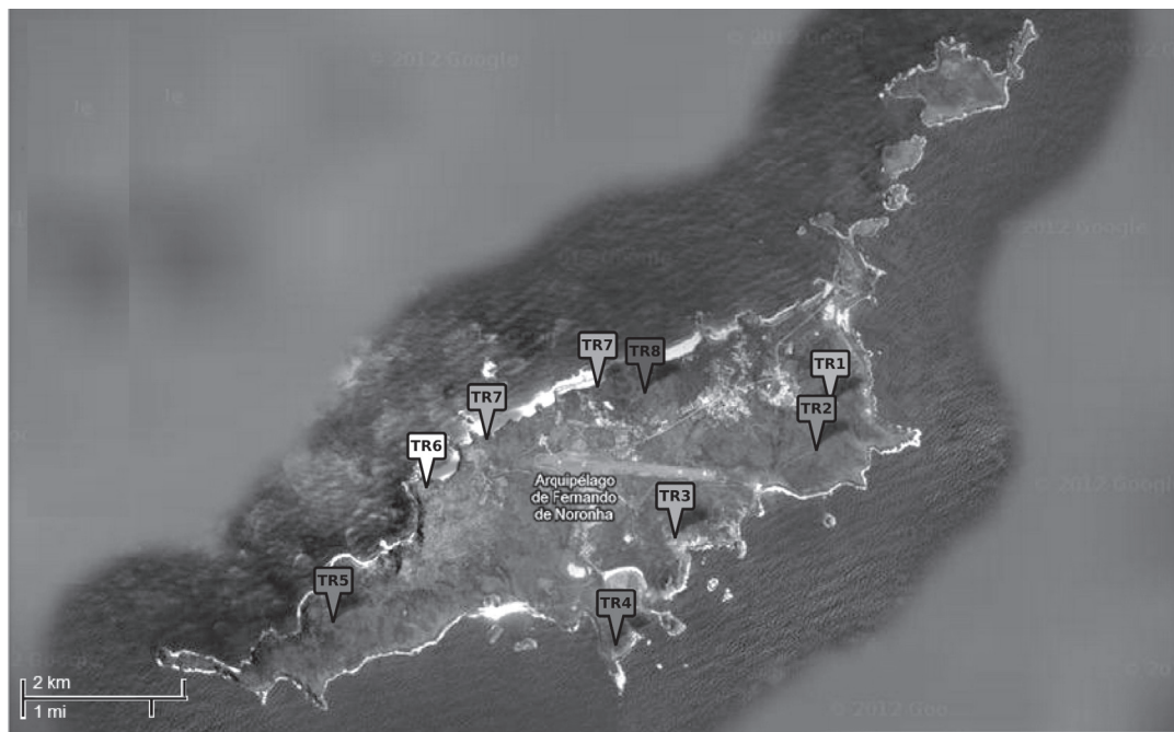
Figura 1. Mapa de localização da área do estudo com indicação das trilhas percorridas para coleta de dados fenológicos em Fernando de Noronha, PE, Brasil.

por D'Eça-Neves & Morellato (2004), tendo sido escolhidas oito trilhas pré-existentes na ilha principal (figura 1). Acompanhou-se nessas oito trilhas a fenologia reprodutiva de 23 espécies nativas arbustivas e arbóreas durante 17 meses. Detalhes sobre essas espécies estão descritos na tabela 1. Os indivíduos de cada uma dessas espécies não foram marcados, nem acompanhados individualmente, apenas considerou-se em cada mês amostrado se cada espécie se encontrava ou não frutificando. Dessa forma calculou-se para cada espécie a Frequência Absoluta de Frutificação ( FAF_i ), que correspondia ao número de trilhas em que a espécie encontrava-se com frutos dividido pelo número total de trilhas amostradas (8 trilhas), multiplicado por 100. Assim, se num dado mês a espécie estivesse frutificando em todas as trilhas, sua FAF_i seria igual a 100% e se não estivesse frutificando em nenhuma delas, igual a 0%. Como entre as espécies variava o número de indivíduos e também sua distribuição espacial pela ilha, algumas espécies não atingiram 100% de frequência em nenhum mês. Por exemplo, a espécie Allophylus laevigatus estava presente apenas nas trilhas TR2 e TR5, logo, a porcentagem máxima de frutificação possível era de 2/8, ou 25%. Essa abordagem permitiu dar uma melhor idéia da dispersão espacial da frutificação